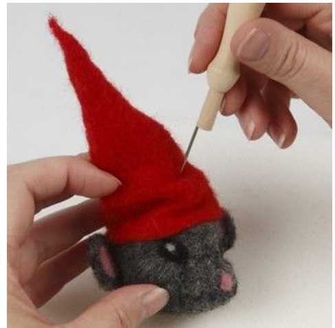
10 Filt folder på huen.