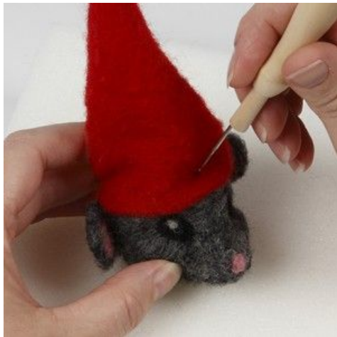
9 Filt huen fast på musen.