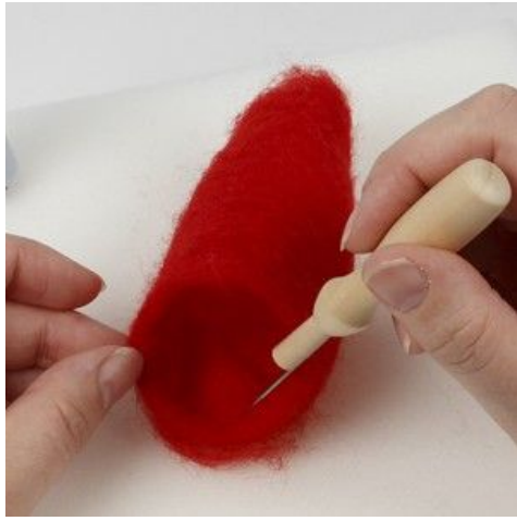
7 Filt huen sammen.