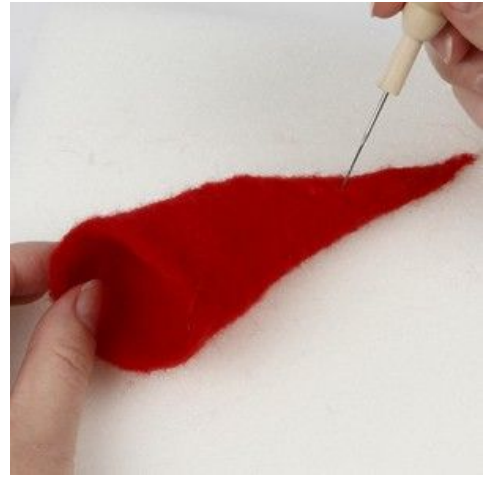
8 Filt huen spids i toppen.