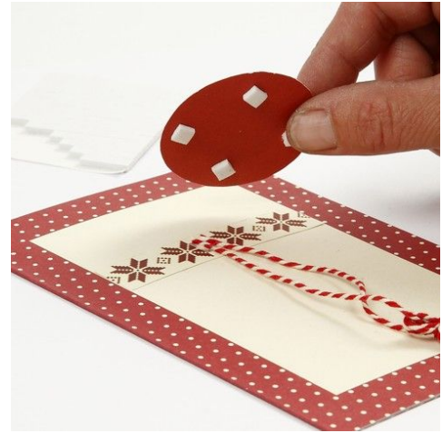
8. Monteres på kortet med 3D puder.