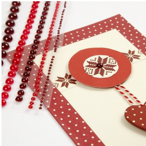
9. Hjertetstickers og halvperle sættes på. Klemmen til ophæng dekorerer med Masking tape.