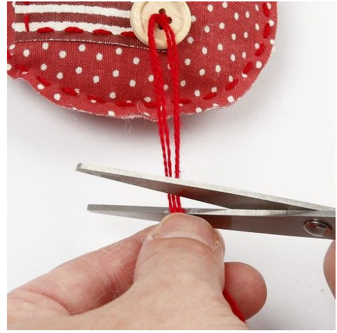
8. Enderne klippes til.