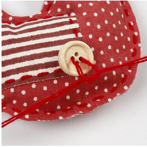
7. Der bindes en knude på tråden.