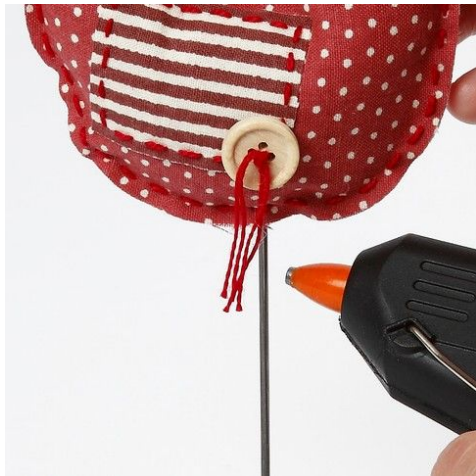
9. Fuglen stikkes ned over metaltråden og limes fast.