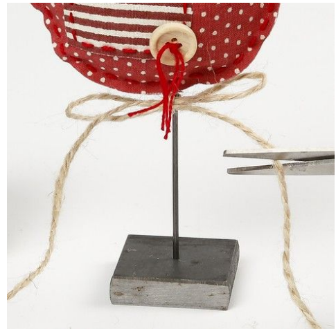
10. En hørsnor bindes om foden og klippes til.