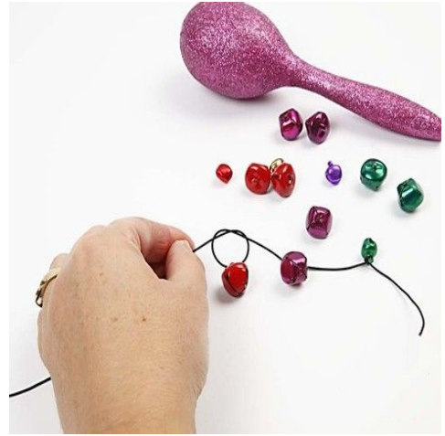
4. Bjælder bindes på elastik.