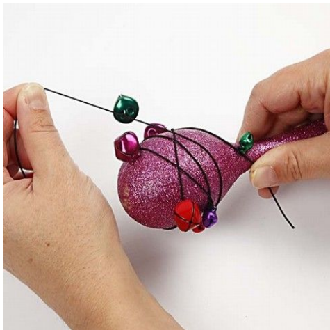
5. Elastikken snoes omkring maracas'en.