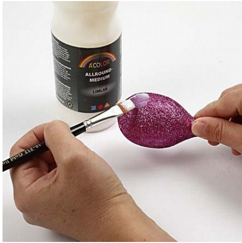
3. Glimmeroverfladen pensles med limlak.