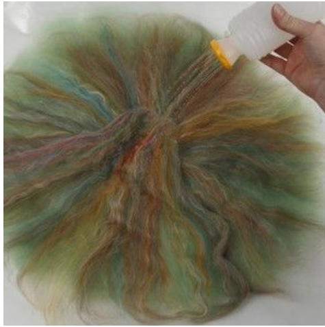
7 Stænk vand på