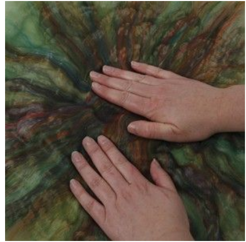
8 Klem luften ud af ulden og felt let.