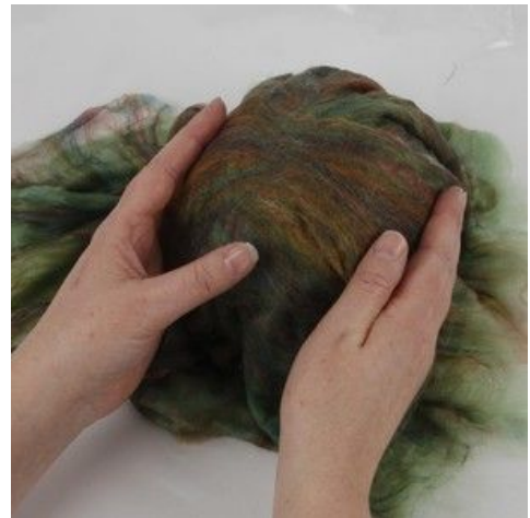
10 Filt først i samme retning som regnbueulden ligger.