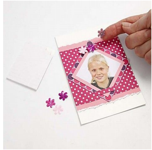
8. Pailletblomster limes på med 3D puder.