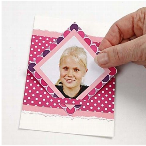
7. Fotorammen sættes fast i båndene.