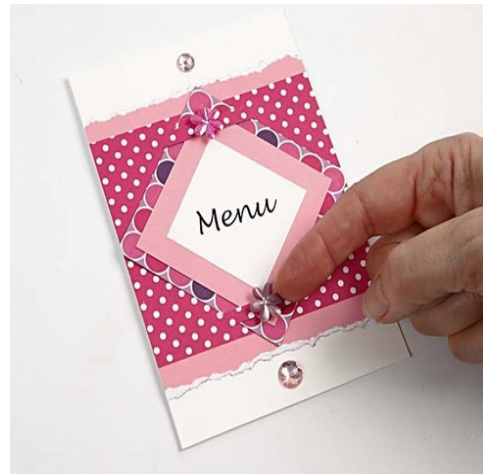
10. Menukortet laves på samme måde med få variationer.