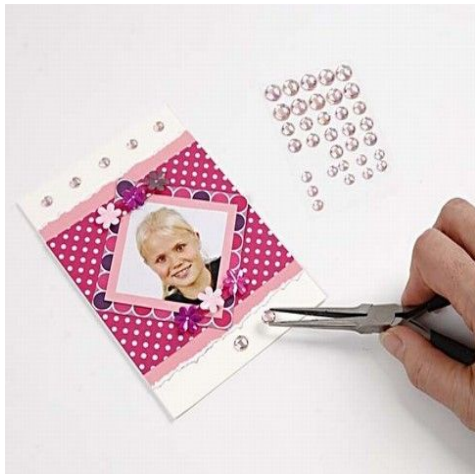
9. Selvklæbende rhinsten sættes på.