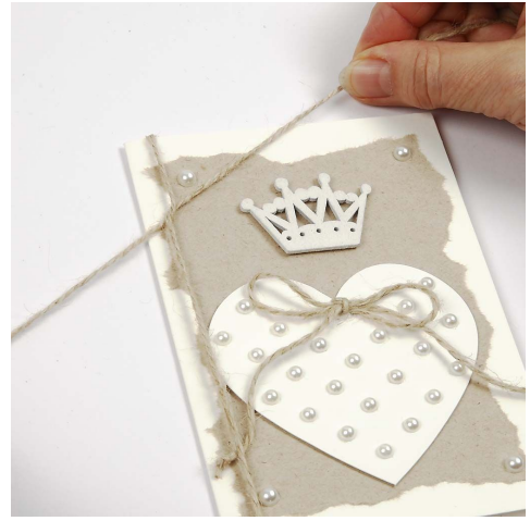
8. Der bindes en snor på kortet.