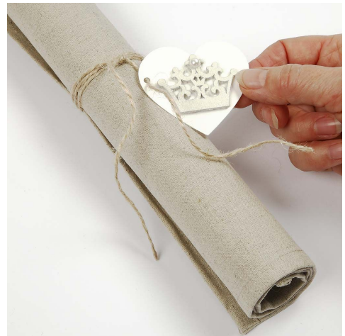
10. Til servietring bruges kartonhjerte, krone, perle og snor.