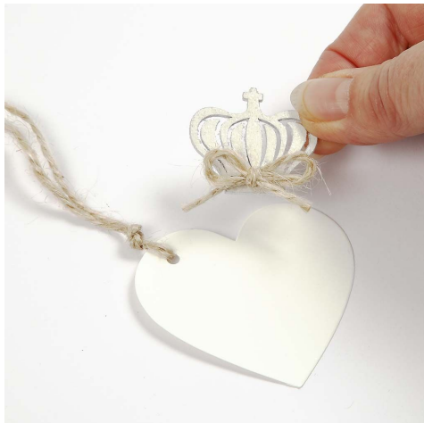
9. Navneskiltet skrives på et lille hjerte, der pyntes med snor, krone og perler.