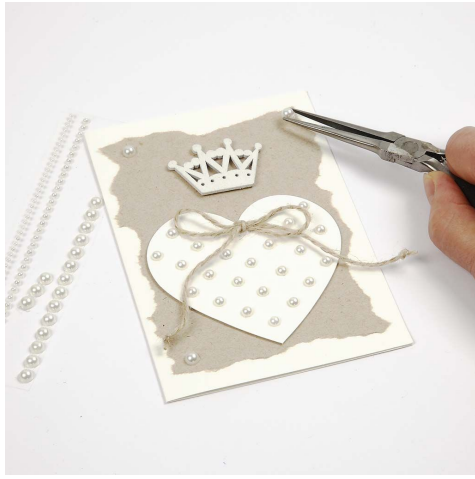
7. Perler limes på i hjørnerne.