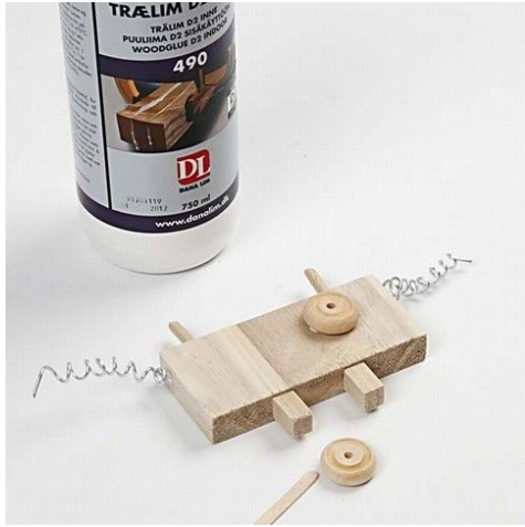
7. Øvrige dele limes på.