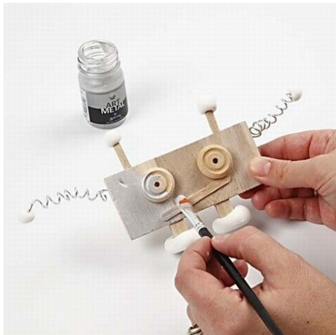
9. Robotten males med Art Metal.