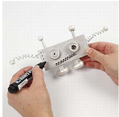
10. Dekoreres med sort tusch.