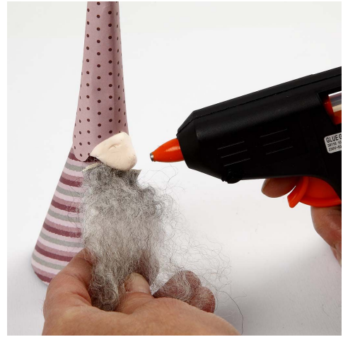
8. Lim skæg på.