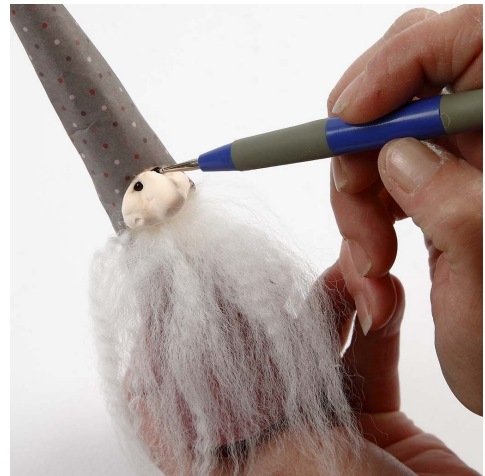
10. Form ansigtet og sæt perler på som øjne.