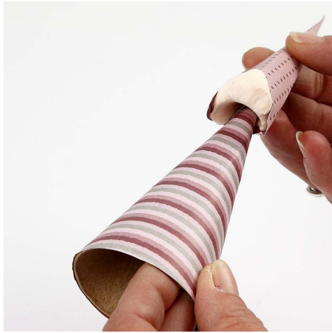
7. Sæt huen på keglen.