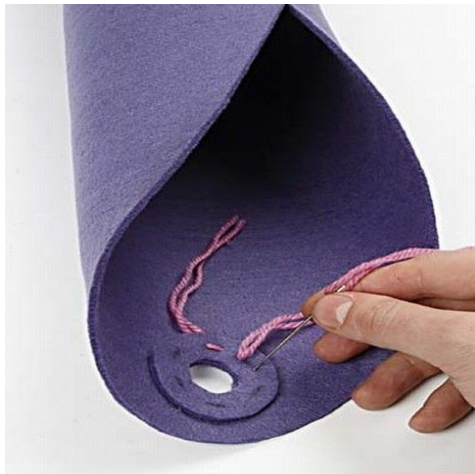
5 Klip hul til ophæng i skjulerens top, og sy en ring på som forstærkning.