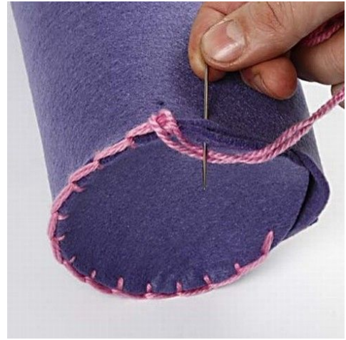
4 Sy bunden på. Her anvendt knaphuls sting.