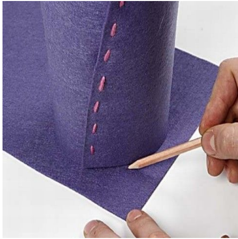
3 Tegn og klip bund.