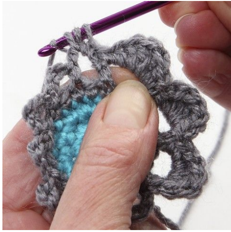
C 1/2 stangmaske.