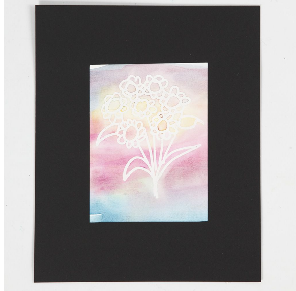
Illustration lavet med tegnegummi

Den viste illustration er lavet med tegnegummi som afmaskning på akvarelpapir. Akvarelfarver er herefter strøget henover med pensel og tørret, hvorefter gummibelægningen er gnedet af.