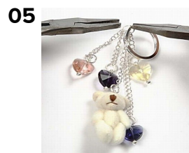
05 Alle vedhængene samles i en o-ring sammen med nøgleringen.