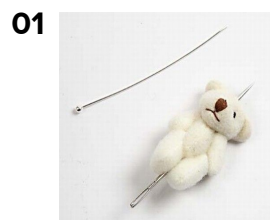
01 Snoren klippes af bamsen, og der "bores" for med en nål, inden kuglestilken stikkes igennem.