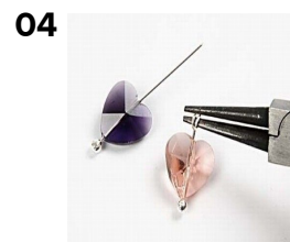
04 Krystalperlevedhæng laves på samme måde.