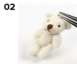
02 Der drejes et dobbelt øje.