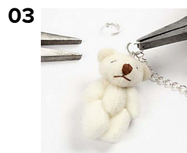
03 Øjet forbindes til et stykke kæde med en o-ring.