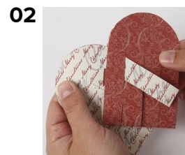
02 Træk en ende fra venstre side ind i højre halvdel.