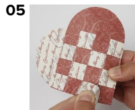
05 Til slut sæt den sidste ende ind i den sidste ende fra den anden halvdel af hjertet.