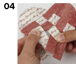
04 Gentag ved alle ender.