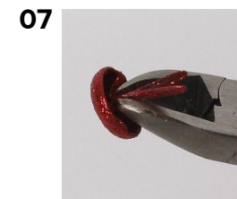
07 Klip benene af en dekonitte.