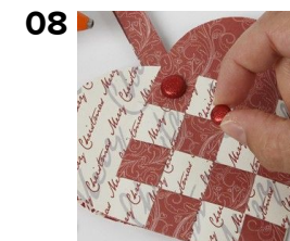
08 Lim dekonitten på med limpistol.