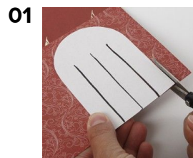
01 Fold papiret, og klip efter skabelonen. Gentag på et andet stykke papir.

Vores flotte Vivi Gade papir er lavet i fire forskellige serier; Helsinki, Oslo, Copenhagen og Stockholm. Giv din jul den farve du synes - eller mix de forskellige serier. □ □