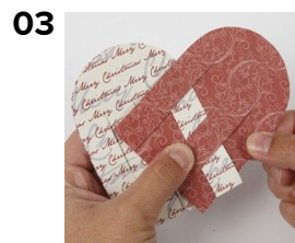
03 Flet enderne skiftevis indeni og udenpå hinanden.