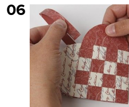
06 Klip en strimmel papir til hank, og sæt denne på med dobbeltklæbende tape.