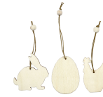
Træophaeng, hare, æg, høne, str. 6 cm, tykkelse 3 mm, 9stk. 56732