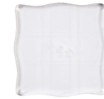
Akrylblok , str. 10x10 cm, 1stk. 24010