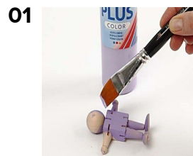
01 Elastikdukken males med Plus Color hobbymaling. Lad tørre.

Små elastikfigurer i træ er malet med Plus Color og tilføjet lille polykrone. Ansigt malet med tusch. Lidt decoupagepapir er limet på kroppen med Decoupage lak mat.