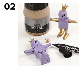
02 Polykrone malet med Art Metal pålimes, og ansigt tegnes med sort tusch.