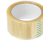
Pakketape, B: 48 mm, 66m 246090