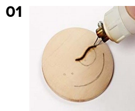
01 Tegn først, og brænd så et motiv på en stor træknop.

Trolde og edderkop køleskabsmagneter lavet af træknapper og figurreb STEP BY STEP 01 02 03 Inspiration: 11346