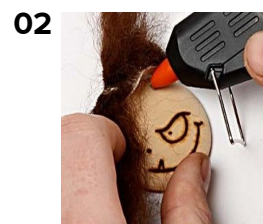
02 Lim pels på som hår.