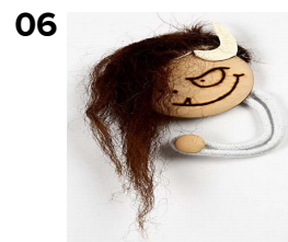
06 Og færdig! Et styks trolld til køleskabet.