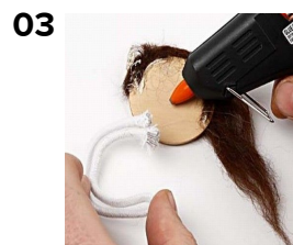
03 Brug figurreb til arme og ben, lim fast på bagsiden.