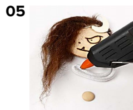
05 Brug små knapper til at lime på som hænder og fødder.