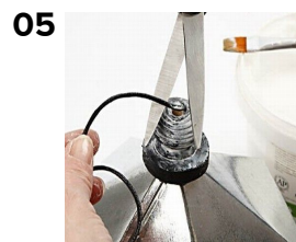
Klip enden af.