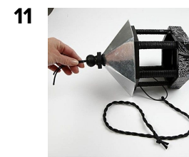
Træk snoren gennem hullet, brug hjælpsnoren.