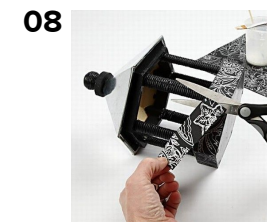
Enden klippes af.