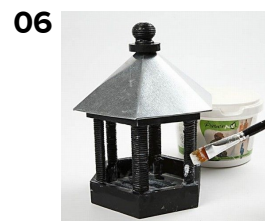
Laker huser med paverpol limen.