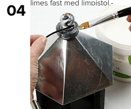
Læg paverpollim på og sno omkring.