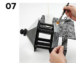
Klip papirstrimmel 50x2,7cm, lim på med paverpol.