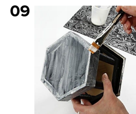
Laker med paverpol limen bunden og papiret.