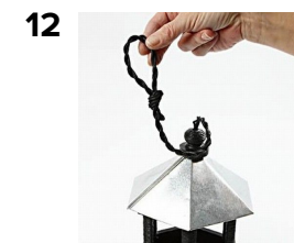
Bind en lykke til ophæng. Klip enderne pænt af.