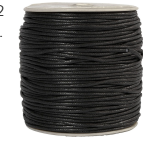
Bomuldssnor, tykkelse 2 mm, sort, 100m 51524