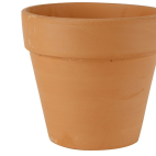
Urtepotte, diam. 12 cm, H: 11 cm, 12stk. 50650