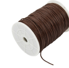
Bomuldssnor, tykkelse 2 mm, brun, 100m 51522