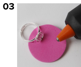
03 Lim delene sammen. Figuren limes fast på ringen.