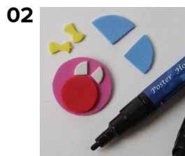
02 Dekorér med tusch efter fantasi.