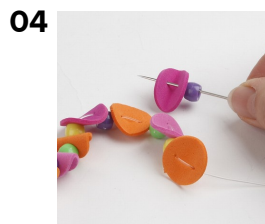
04 Fold cirkler og træk dem på smykkeelastik, sæt perler imellem hver cirkel. Forsæt til den ønskede størrelse, afslut med en knude.