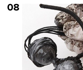
Lim hår på og form det.