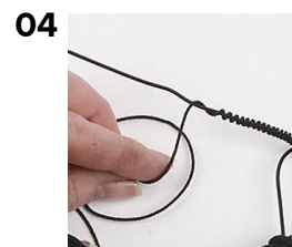
Vikl snor om skelettet.