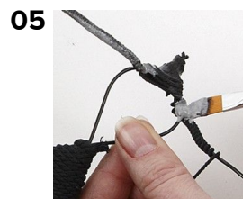
Pensel lim på når snoren er viklet om.