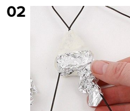
Beklæd skelettet med stanniol og malertape på de steder hvor der ønskes ekstra fylde.