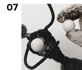
Lim brystet og hoved fast på dukken.