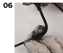
Arranger dukkens stilling mens limen stadig er våd.