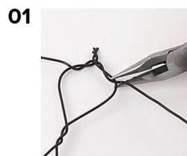
Form et skelet i blomstertråd.