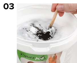
Bland sort farve i paverpol limen.