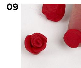
Form en eller to små effekter i cernit. Bag effekterne i ovnen 30 min. Ved 130 grader.