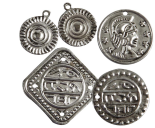
Metalplader, str. 13-20 mm, hulstr. 1-1,2 mm, forsølvet, 90ass. 60502