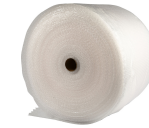
Bobleplast, B: 50 cm, 150m 13197