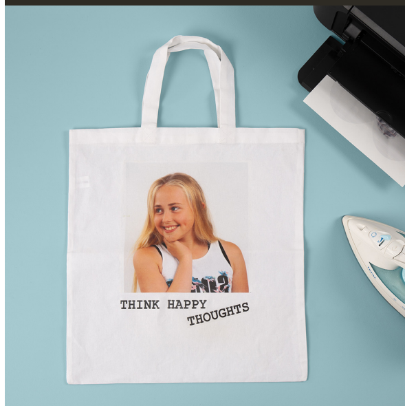
Foto overført til mulepose med transferark

Dekorer en stofpose med et foto printet på transferpapir. Transfermotivet holder på lyst bomuld. □ Stofposen tåler efterfølgende vask med vrangside ud ved 30° C. Vask posen separat første gang. □ Vil du bruge transferark på andre materialer, så lav en prøve først.