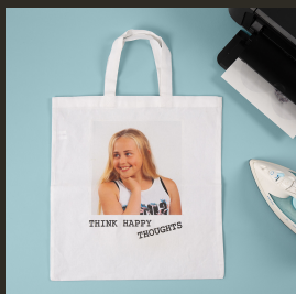
Foto overført til mulepose med transferark